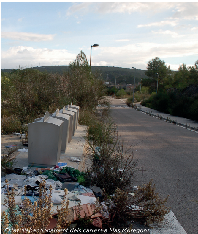
Estat d'abandonament dels carrers a Mas Moregons