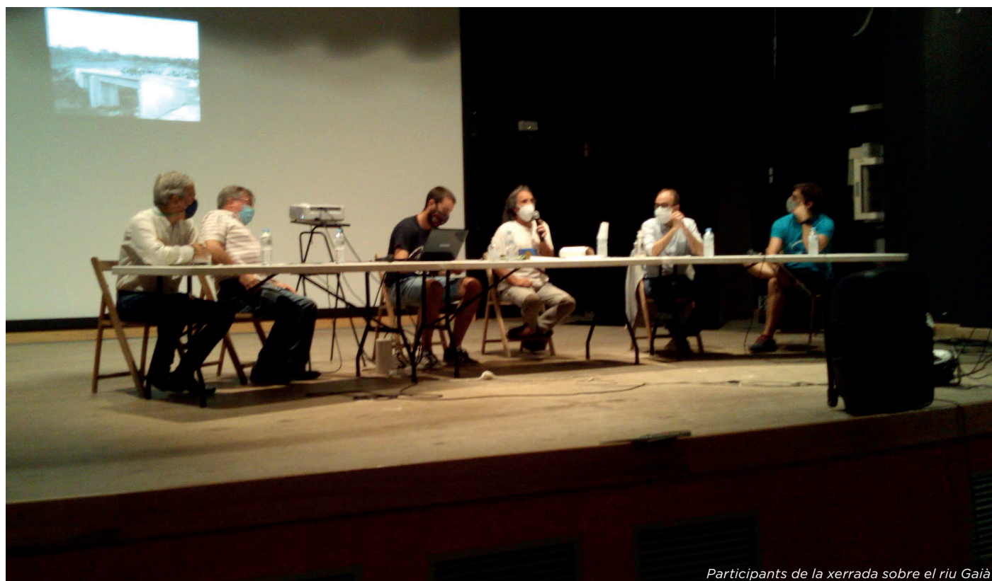
Participants de la xerrada sobre el riu Gaià